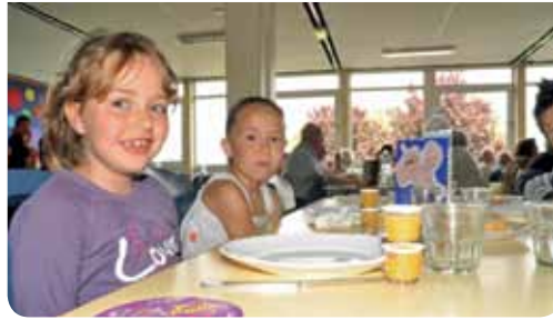
84% des familles ayant répondu à l'enquête sont satisfaites de la restauration scolaire...

84% sont satisfaits de la restauration scolaire