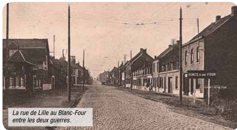
La rue de Lille au Blanc-Four entre les deux guerres.

En quelques dizaines d'années, on observe la disparition des quelques masures bâties en torchis avec auvent de chaume qui ponctuaient encore