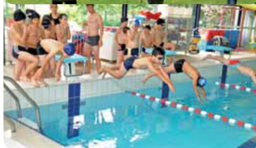
... 97,3% sont satisfaites des ALSH organisés durant l'été et les petites vacances scolaires.