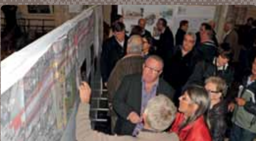
Le 20 octobre, à l'église Saint-Roch, la population était conviée à une présentation globale des différents projets.