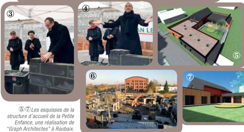
⑤⑦ Les esquisses de la structure d'accueil de la Petite Enfance, une réalisation de "Graph Architectes" à Roubaix.

Public bénéficiant de "l'Association Service des Familles" en 2012 : 204 familles pour les Etablissements d'Accueil du Jeune Enfant, 65 assistantes maternelles pour le RAM, 180/200 personnes pour les ateliers parents/enfants, 250 personnes assistent aux conférences parentalité