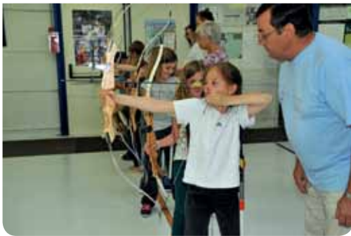
... 79,5% des familles ont été bien informées du lancement de l'AMIS...

Les conclusions de cette vaste enquête téléphonique menée par la société "Qualisondages" pour la Ville en juin et juillet derniers sont unanimes : les familles sont globalement satisfaites des formules d'accueil proposées à leur(s) enfant(s), elles s'informent au Guichet Unique de l'Annexe-Mairie, dans les écoles ou encore sur le site www.roncq.fr (principalement l'Espace Famille).