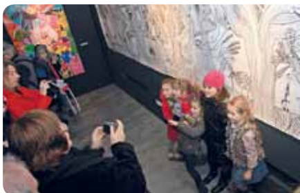
Lors de l'exposition de ces travaux d'enfants, aux Anciennes Ecuries, du 14 au 20 décembre. Ce fut un enchantement pour entrer dans une dimension fantastique !

A l'école primaire Pablo-Neruda, les enfants de CM2 de la classe d'Hélène Comyn ont rivalisé d'imagination pour échafauder une histoire et la transcrire dans un livre illustré. Personnages énigmatiques, voire bicéphales, créés à partir de vieilles poupées... toutes les écoles se sont imprégnées de ce monde où les rêves et les chimères prennent forme !