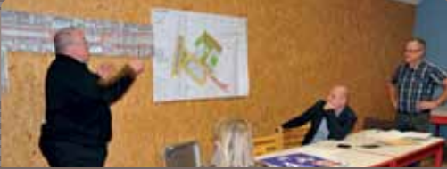
Le 4 octobre, les opérations de requalification avaient été présentées aux acteurs économiques et scolaires.

La reconquête du Blanc-Four, promesse de Vincent Ledoux en 2008, bat son plein. Après le démarrage en septembre dernier des chantiers de construction de la Maison Petite Enfance et de la Maison de quartier, va démarrer en février 2013 le réaménagement du parvis et du pourtour de l'église Saint-Roch et en octobre 2013 la refonte de la rue de Lille en zone 30 depuis la rue de Tourcoing jusqu'à la rue du Bois Blanc.