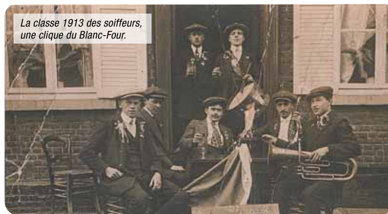
La classe 1913 des soiffeurs, une clique du Blanc-Four.

Dans la série "Si Roncq m'était conté..." produite par le Club Ronquois d'Histoire Locale, le tome 3 "Témoignages de familles", en vente au prix de 5€.